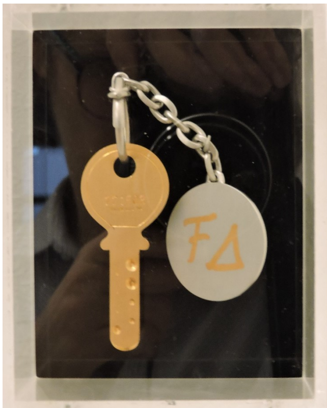
Alter Hausschlüssel der Familie Dürrenmatt

Die Lehrperson kann zur Vorbereitung Friedrich Dürrenmatt und das Centre Dürrenmatt Neuchâtel vorstellen. Entsprechende Einführungen sind im pädagogischen Kit enthalten.