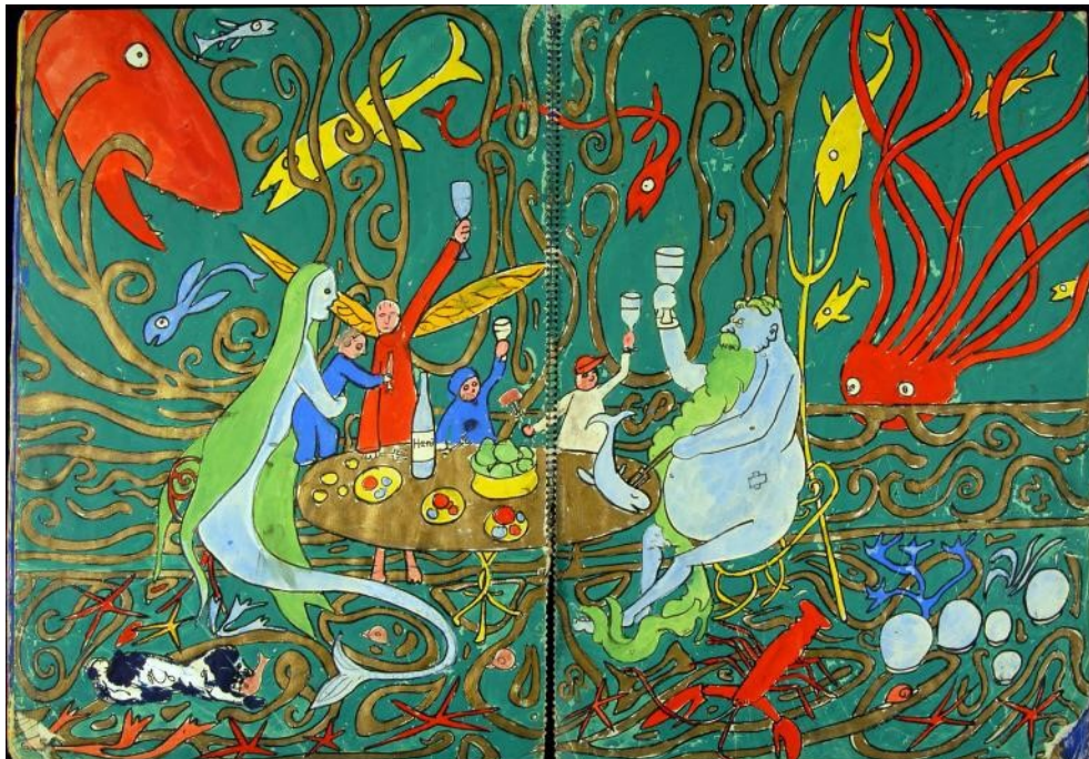
Ausschnitt aus der Bildergeschichte