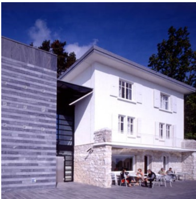
Das ehemalige Wohnhaus Friedrich Dürrenmatts und ein Teil des Erweiterungsbaus von Architekt Mario Botta.