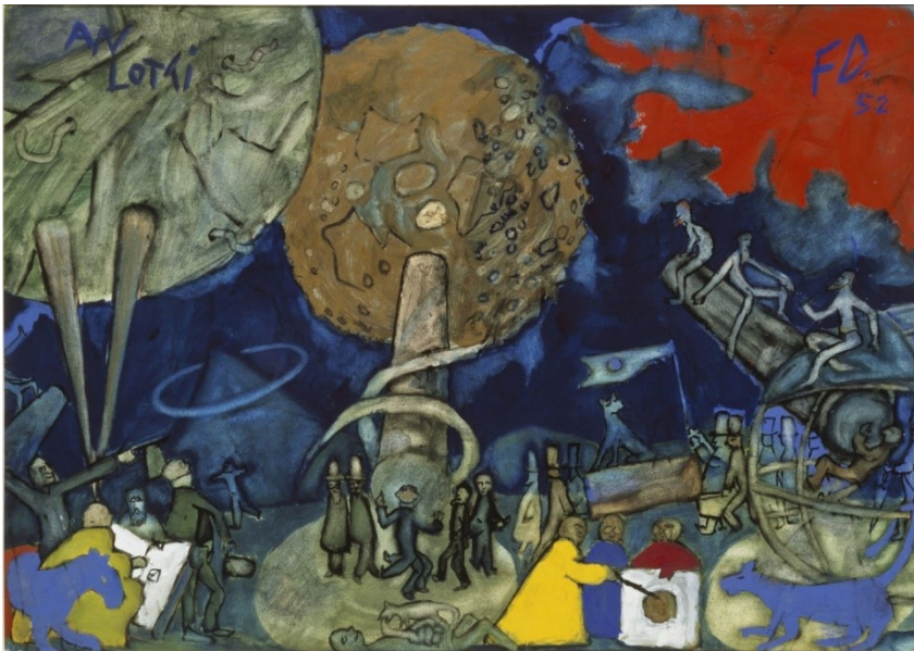
Die Astronomen, Gouache, 1952.

Die Lehrperson kann zur Vorbereitung Friedrich Dürrenmatt und das Centre Dürrenmatt Neuchâtel vorstellen. Entsprechende Einführungen sind im pädagogischen Kit enthalten.