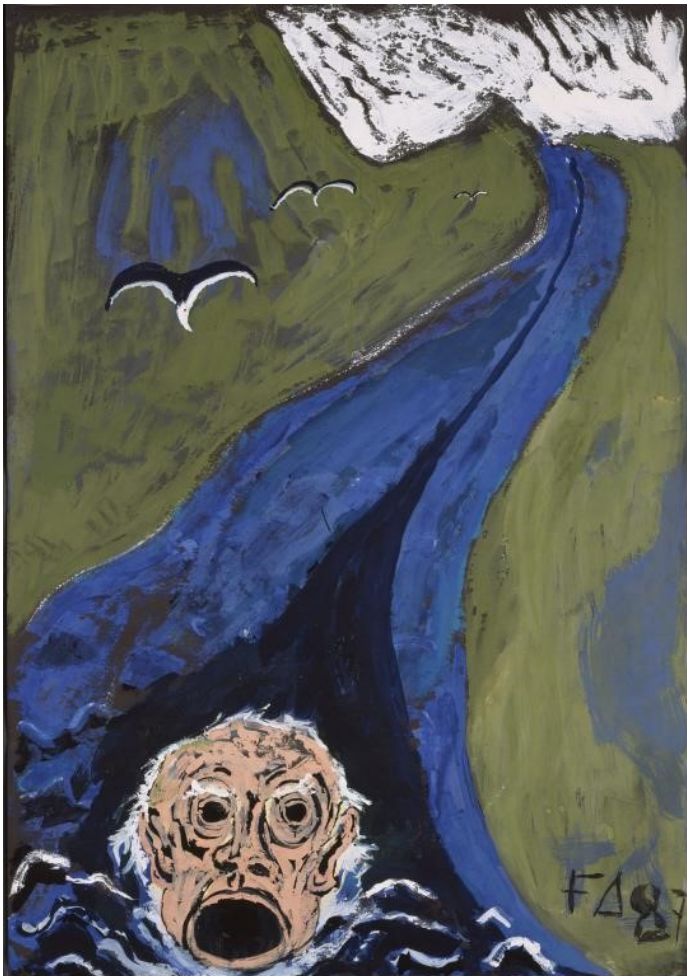
Der singende Kopf des Orpheus treibt den Styx hinunter, 1987.

Die Lehrperson kann zur Vorbereitung Friedrich Dürrenmatt und das Centre Dürrenmatt Neuchâtel vorstellen. Entsprechende Einführungen sind im pädagogischen Kit enthalten.